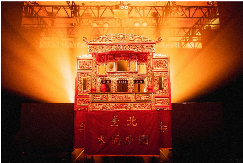
臺北木偶劇團《得時の夢》

2010年，因有感於傳統藝術急劇凋零，傳承不易，一群習藝超過15載，平均年齡三十許的青年偶、樂師創立了臺北木偶劇團，以首都為名，將深耕、延續古老且精美的布袋戲文化為職志，希望世界看見臺灣，就看見偶戲。長期深耕親子藝文活動與校園推廣，並連續13年，獲得Taiwan Top國家演藝團隊肯定。