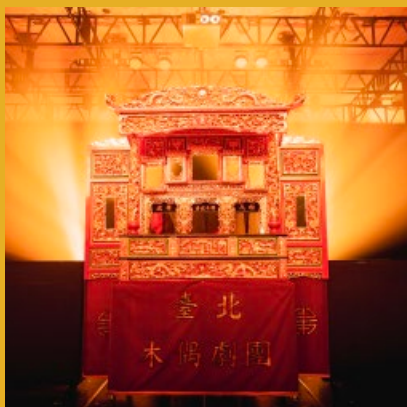
臺北木偶劇團《得時の夢》